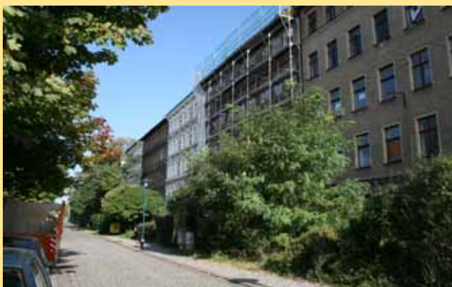
Gerüste im "Urwald"

Die Gnadauer Straße 5 hat einen neuen Eigentümer erhalten, der schon kräftig beim Sanieren ist. Fassade und Dach werden bald im neuen Glanz erstrahlen und auch die Erdgeschosse werden ausgebaut.