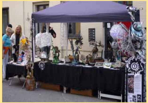
Künstler und Designer aus der Klosterbergstraße präsentierten sich beim Buckauer Stadtfest

Zum Kunstfest in der Klosterbergstraße werden sie auch wieder vertreten sein und die Straße illuminieren.