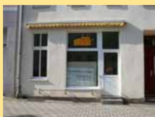
Bäcker auf der Schönebecker Straße hat aufgegeben

Leider haben sich alle diese kleinen Läden des täglichen Bedarfs in Buckau nicht halten lassen. Selbst der Blumenladen in der Basedowstraße hat irgendwann aufgegeben. Die Zeit der „Tante Emma Läden“ ist vorbei.