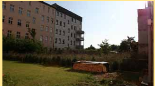
gemeinsame Hofgestaltung noch möglich?

Schade nur, dass auf dem großen Hof der Gnadauer Straße 5-7, der durch den Abriss der hinteren Seitenhäuser geschaffen wurden, bisher keinerlei gemeinschaftliche Aktivitäten zu verzeichnen sind.