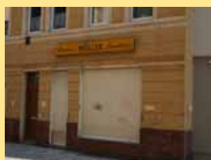
Bäckerei Müller gibt 's nicht mehr