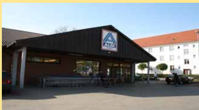
Aldi hat alles

Nur deshalb wurde die Idee geboren, die leerstehenden Ladenlokale mit Kunst zu beleben.